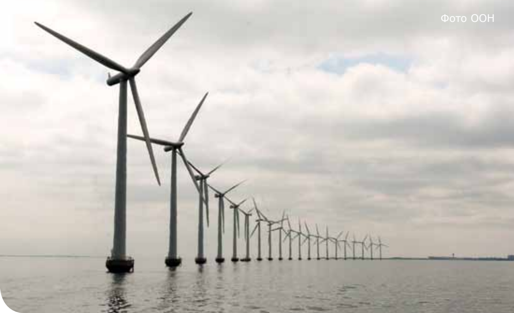
Ветряная электростанция на шельфе, Мидделгруден, Дания