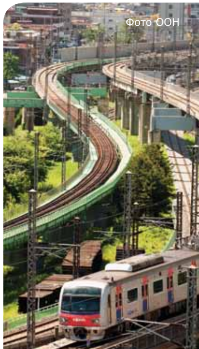
Извилистый путь электрички в Сеуле, Республика Корея