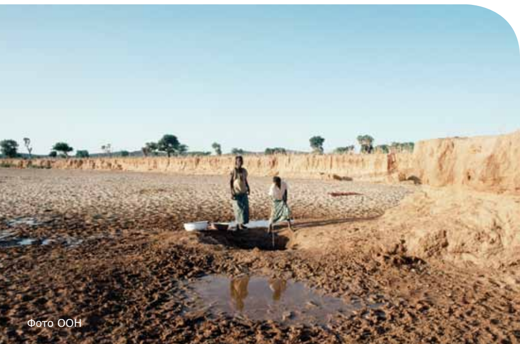
Пересохшее русло реки в Нигере