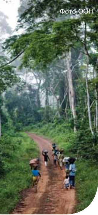
Леса в Либерии

«Повестка дня по вопросам устойчивого развития — это повестка дня по вопросам экономического роста на XXI век».